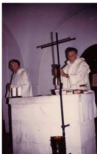
Chapelle de St Isaïe