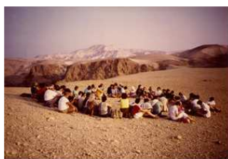
Bible Sur le Terrain

Il y a encore la route d'Emmaüs, pour apprendre que toutes les routes de l'existence peuvent être des routes d'Emmaüs avec le festin de la Parole et le festin Eucharistique indissociablement unis ».